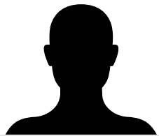
Le Référent COVID

✓ Coordonne la mise en oeuvre du dispositif sanitaire et en assure le pilotage.