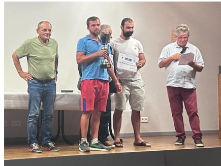
ES BENEVENT-MARSAC (Champion Départemental 1)