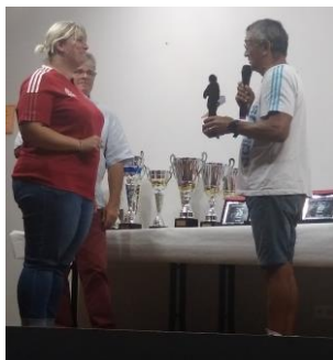
Trophée Corinne DIACRE