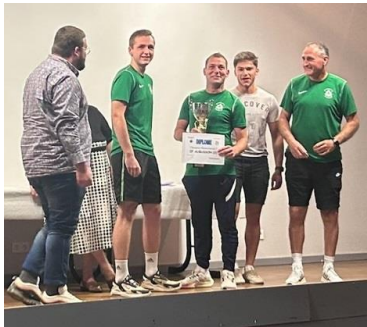
EF AUBUSSON (Champion Départemental 2)