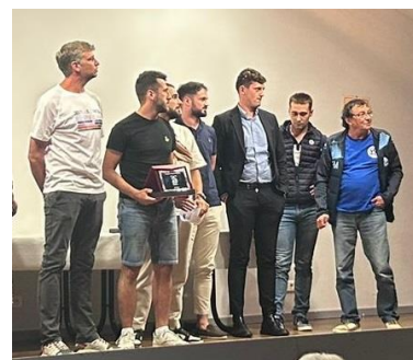
GOUZON AVENIR (Vainqueur Coupes de la Creuse et Jean Bussière)