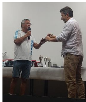
Trophée Georges Boulogne