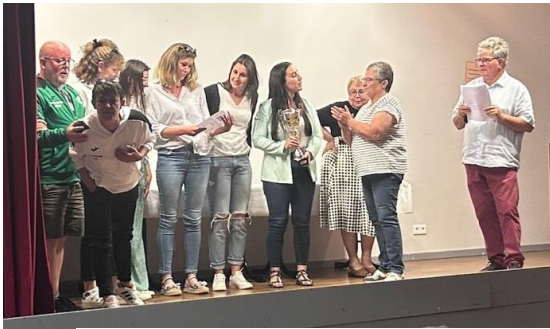
ES AHUN Féminines (Champion Division 2)

Pour finir, les clubs vainqueurs et Champions sont montés sur la scène !