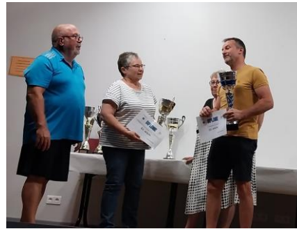
ES AHUN (Champion Futsal)