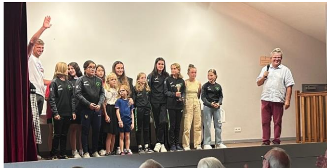
FOOT GENERATION 2000