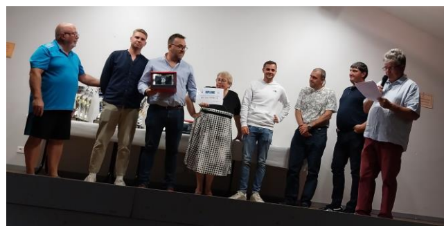
RFC Ste FEYRE

(Vainqueur Coupes André Latéras et Gilbert Andrivet)