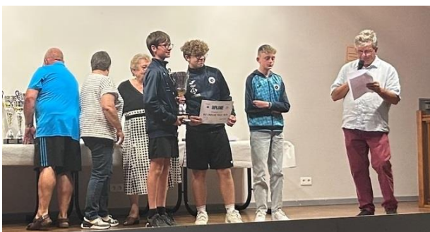
GJ CREUSE POLE SUD (Champion U15 et U17)